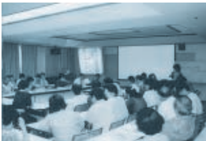
写真：分科会2の様子