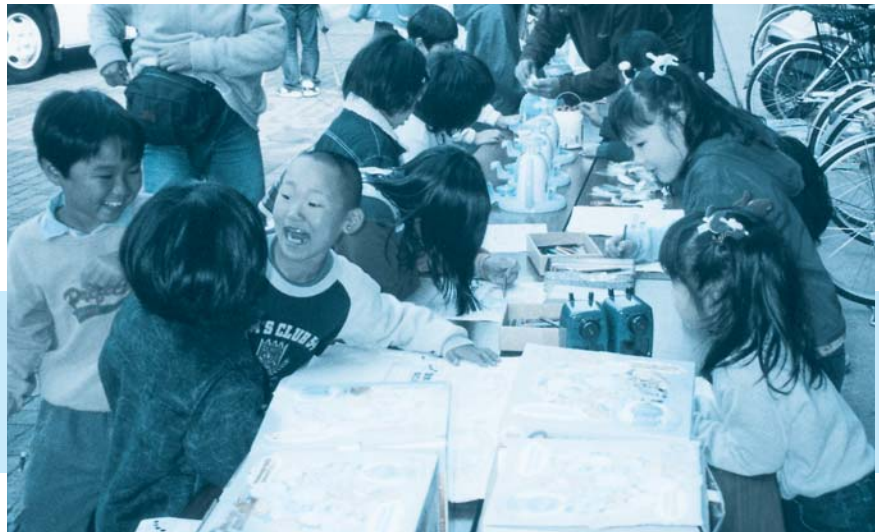
ぬり絵やカンパジづくりで夢中の子どもたち

のコミュニケーションの場として活用してもらうことが必要ですし、長い目で見たとき、地域の協力はこれからも不可欠です。」