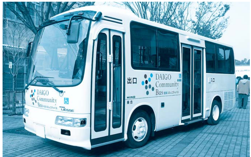
白の車体が美しい醍醐コミュニティバス